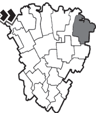
Личківські землі межують із сусідньою Харківщиною.

ти давно баечку про те, як один нишпорка ніяк не міг збагнути, хто поміж трьома ним затриманих обікрав крамницю. Тоді він забіг у камеру з затриманими і закрячав: «На крадієві шапка горить!» Крадій і схопився за свою голову. А якщо у нашій ситуації гукнути, що на рейдерів шапка падає – кому доведеться підхлюватися і хпатися за свою голову? Отож!